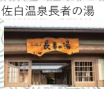
佐白温泉長者の湯